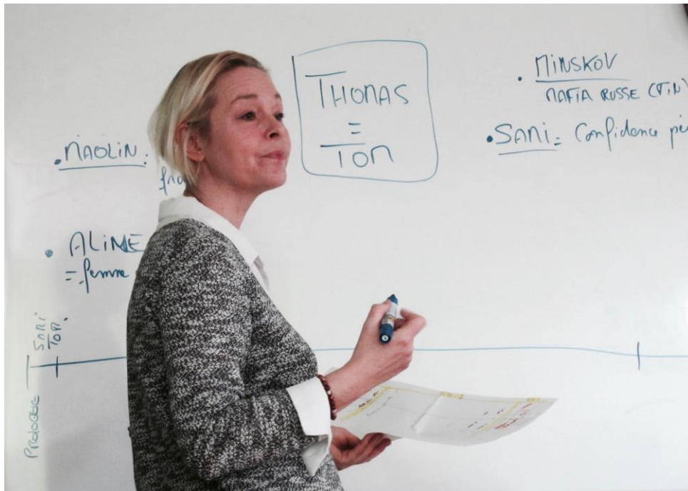
Situer les éléments clés du récit, caractériser les personnages...

Voici plusieurs de ces épilogues, sous forme de scénario ou de synopsis.