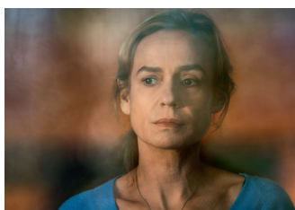
Sandrine BONNAIRE dans le rôle de CATHERINE