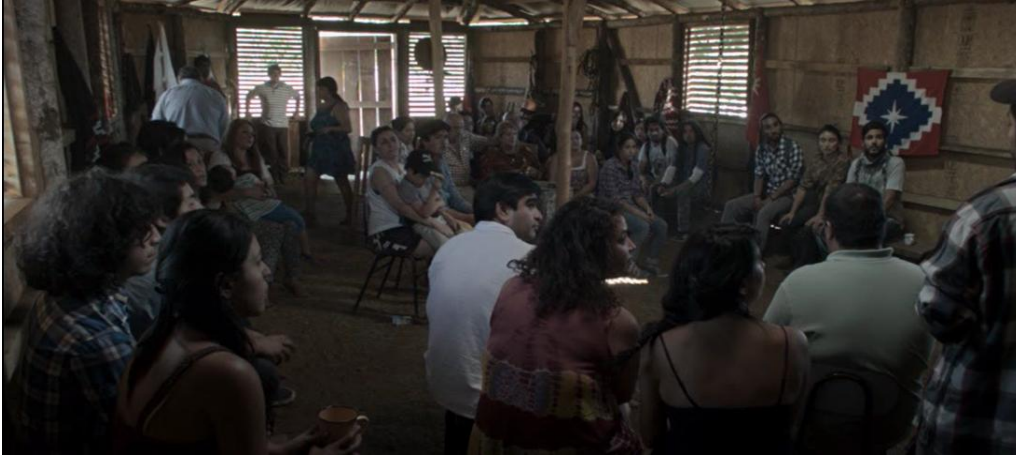
Reunión de la comunidad mapuche